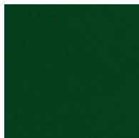
2404 Kuusen- vihreä