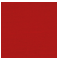
2311 Karminin- punainen